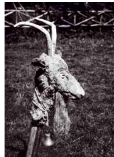
Näärಿಸoku pea Läänemaalt Kirbla kihelkonnast H. Tampere 1969 Eesti Kirjandusmuuseumi arhiiv

Üks imelikke tegelasi on mitme nimega: niglo, niglas, Nikolaus, Santa Claus. Austrias ilmusid lagedale õlgedesse või kuuseokstesse mähitud niglod – metsikud tahmase näoga käratsejad, ja nad ei jätnud karistamata halbu lapsi, kelle nimed olid püha Nikolause raamatusse kirja pandud. Arvati, et need on tegelikult põllu- ja metsavaimud. Ühte olevat nähtud tohutus suure peaga ning linnukehaga kolmejalgse elukana. Ühel Ungari Nikolausel oli saatjaks kaks kuradiit, ingel ja veel kaks teenrit, aga ta oli ka ise kuradi moods: tagurpidi kasukas seljas, karvane müts peas, mask näo ees. Kuid nähti ka päris ehtsat Nikolaust, kel pikk valge habe, punane piiskopimantel seljas ja müts peas ning ametikepp käes. Koos oma teenriga ilmus ta peredesse nii linnas kui maal, poetas väljapandud saapakeste sisse headele lastele kingitusi – kommi, puuvilja, mänguasju, aga pahadele väikese vitsakimbu või paharetikuju.